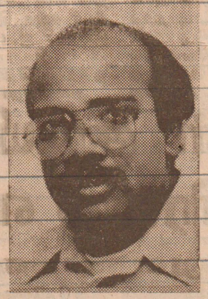
கமநலசேவைகள் உத்தியோகத்தர்கள், யாழ் மாவட்டம். (4179)

“இந்திய அரசின் வஞ்சனையால் வங்கக் கடலில் சங்கமமான தங்கத் தளபதி கேணல் கிட்டுவிற்கும் பங்கமில் தம் பங்கினை ஈந்த வீரவேங்கைகள் ஒன்பதின்மருக்கும் எங்கள் இதய அஞ்சலிகள்”