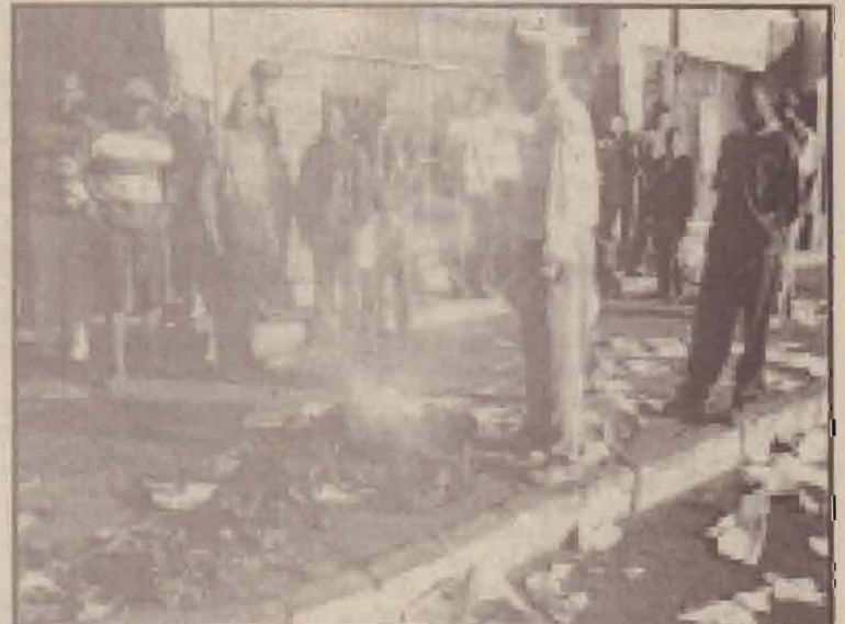
சிம்பால்வேலில் முகாபேக்கு எதிரான ஆர்ப்பாட்டங்களில் ஒரு பகுதியாக செய்திப் பத்திரிகைகள் எரித்தும், கிழித்தும் வீடப்பட்டிருக்கின்றன. பத்திரிகை வீர்ப்பணையாளர் அவற்றைப் பார்வையிடுகின்றார்.

ராஜஸ்தானில் இந்திய விமானப்படைக்குச் சொந்தமான மிக்-21 ரக போர் விமானம் ஒன்று விபத்துக்குள்ளாகி தரையில் விழுந்து நொருங்கியது. இந்த விபத்தில் அது விமானி உயிரிழந்துள்ளார். நேற்றுக் காலை ராஜஸ்தானிலுள்ள உத்தரனை விமானத்தளத்திலிருந்து ஊர்ப்படும் செறை சிறிது நேரத்தில் இந்த விமானம் தப்பிடித்துள்ளது. இதனால் கட்டுப்பாட்டை இழந்த விமானம் ராஜஸ்தானின் சிந்த்படி எனும் பகுதியாக ஒரு ஸ்பலில் விழுந்து நொருங்கியுள்ளது. இந்தக் கேள்வி விமான விபத்தில் விமானி உயிரிழந்துள்ளதாக இந்திய விமானப் படை வட்டாரங்கள் தெரிவிக்கின்றன. இந்த விபத்துக் குறித்து தீர்மானித்து விசாரணைக்குள் உத்தர விடப்பட்டுள்ளது.