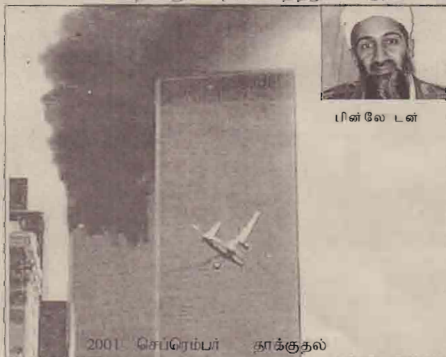
2001 செப்ரெம்பர் தாக்குதல்

மறுபுறம், ஈராக்கிலும், ஆப்கானிஸ்தானிலும் புள்ளி பதித்துள்ள அமெரிக்கா