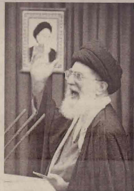
ஈரான் சனாதிபதி முகமது கடாபி

அதேநேரம், ஆப்கானிஸ்தான், ஈராக்கில் எதிர்ப்பாளர்கள் நாட்டினுள்ளேயே இருந்தமையினால் அமெரிக்காவிற்கு நன்மையளித்தமைபோல், ஈரானின் உள்ளே இல்லாத எதிர்ப்பாளர்களை வெளியே இருந்து கொண்டு வந்து கிளர்ச்சியை ஏற்படுத்துவது என்பது நடக்கக் கூடிய காரியமா...? எனும் கருத்தும் இல்லா