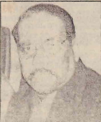
முதன்முதலாக விடுதலைப் புலிகளின் தலைமை முன்வைத்துள்ள பரிந்துரை தொடர்பாக கண்ணோட்டமும், உங்களது அரசு அளிக்க முன்வந்துள்ள அபிவிருத்திக் கட்டமைப்புத் தொடர்பான கண்ணோட்டமும் வெவ்வேறானவை (08ஆம் பக்கம் பார்க்க)

உங்களது பரிந்துரைகள் எங்களுக்குத் திருப்தி அளிக்காமையினால் அதை நாங்கள் ஏற்க முடியாது. எங்களது நிலைப்பாட்டை மறுபரிசீலனை செய்து எங்களது தலைமையின் பரிந்துரைக்கு ஏற்ப இடைக்கால நிர்வாகக் கட்டமைப்புத் தொடர்பான வரையை எங்களது பரிசீலனைக்கு வைத்தால் நாங்கள் மீண்டும் பேச்சுவார்த்தையை ஆரம்பிக்கத் தயாராக இருக்கின்றோம். இவ்வாறு புலிகளின் அரசியல் ஆலோசகரும், தத்துவாசியருமான அன்ரன் பாலசிங்கம் அவர்கள் சீர்திருத்தப் பிரதமர் ரணில் விக்கிரமசிங்கவின் கடிதத்திற்கு நேற்று அனுப்பி வைத்துள்ள பதில் கடிதத்தில் தெரிவித்துள்ளார்.