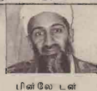
பின் லே டன்

இரு புள்ளிகளையும் இணைக்கும் நேர்கோட்டு முயற்சியில் ஈரானைக் கையாளுதல் என்பதில் என்ன நிச்சயம் இருக்க முடியும்? எனும் ஐயமும் அவதானிகளிடையே புகுந்துள்ளது.