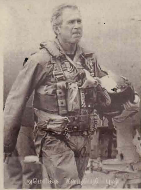
அமெரிக்க சனாதிபதி புல

ஈராக்கை அடுத்து அமெரிக்காவின் இலக்காக ஈரான் அமையவுள்ளது என்பதை அமெரிக்காவின் கண்டனமும், எச்சரிக்கையும் ஊர்ஜிதம் செய்கின்றன. ஈரான் தொடர்பாக, அண்மையில் அமெரிக்காவால் வெளியிடப்படும் குற்றச் சாட்டுக்கள் அடுத்த குறி ஈரானே எனப் பறைசாற்றுகின்றன.