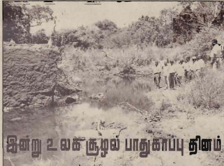
இன்று உலக சூழல் பாதுகாப்பு தினம்

1980களின் பின்னர் தொடர்ந்து வந்த போர் எமது சூழலுக்கு ஏற்படுத்திய பாதிப்புக்கள் தான் வடகிழக்குப் பிரதேசத்தின் பிரதான சூழல் நெருக்கடியைத் தோற்றுவித்தது