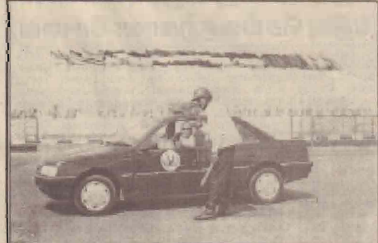
எனியத்தில் அமெரிக்க சனாதிபதி அஜூஷிப் தலைவர்கள் சந்திப்பு நடைபெற்ற வீடுதி வாசலில் பலத்த பாதுகாப்பு

எனவே தீவிரவாதம் தலைவிரித்தாடும் இஸ்ரேல் - பலஸ்தீனப் பிரச்சினைக்கு முற்றுப்புள்ளி வைக்க பல முக்கிய முடிவுகள் எடுக்கப்பட்டுள்ளதாகவும் சனாதிபதி புஷ் கூறியுள்ளார். இதன் மூலம் இஸ்ரேல்-பலஸ்தீனப் பிரச்சினைக்கு விரைவில் தீர்வு காணப்படும் எனவும் அவர் கூறியுள்ளார். இதனிடையே நல்லெண்ணை அடிப்படையில் இஸ்ரேல் அரசு ஈராணமான பலஸ்தீன போர்க்கைதிகளை விடுவித்துள்ளது குறிப்பிடத்தக்கது.